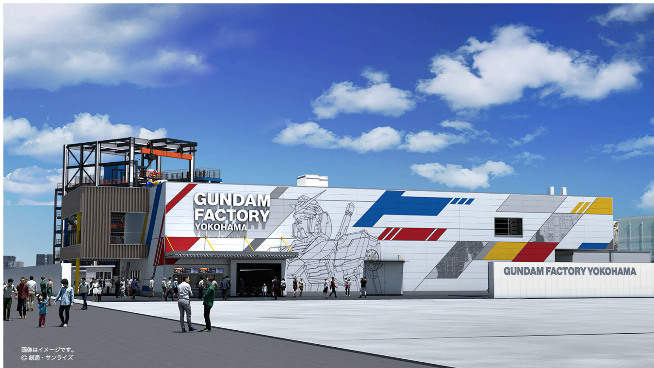
「GUNDAM FACTORY YOKOHAMA」外観イメージ

18m の実物大ガンダムを動かし一般公開を目指すという「ガンダム GLOBAL CHALLENGE」では、夢の実現に向けて 2014 年から幅広くアイデアやプランを募集しながら日本が軸となってグローバルなプロジェクトを推進してきました。研究者、エンジニア、クリエイターなど、各界のプロフェッショナルが集結しオープンイノベーションを通じて様々な意見、智慧と技術を取り入れながら、1 つのプランへと集約。基本設計から実施設計、検証実験を重ねて、いよいよ製作段階に入りました。