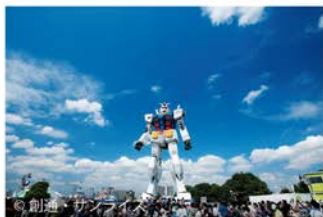
2009年「GREEN TOKYO ガンダムプロジェクト」(東京都お台場・潮風公園)