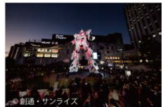
2017年「実物大ユニコーンガンダム立像」(東京都お台場・ダイバーシティ東京)