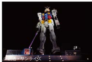
2010年「RG1/1 ガンダムプロジェクト」(静岡県静岡市・東静岡広場)