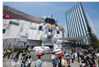
2012年「RG1/1 RX-78-2 ガンダム Ver.GFT」(東京都お台場・ダイバーシティ東京)