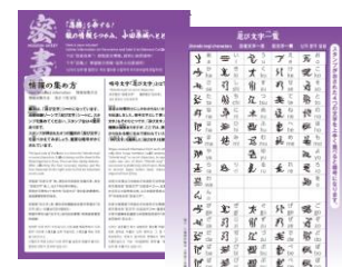
「忍務」の鍵となる密書。情報は更新され、地域へと興味を拡げる