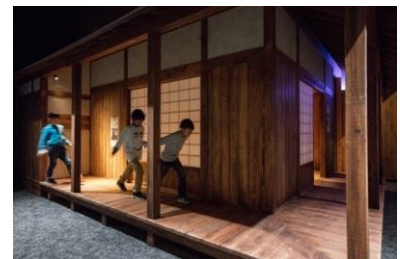
小田原産木材を使用した「からくり屋敷」